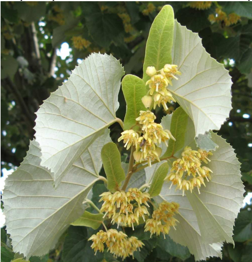
Listy – střídavé

Květy – oboupohlavné, ve vrcholících s listěncem, kalich i koruna pětičetné